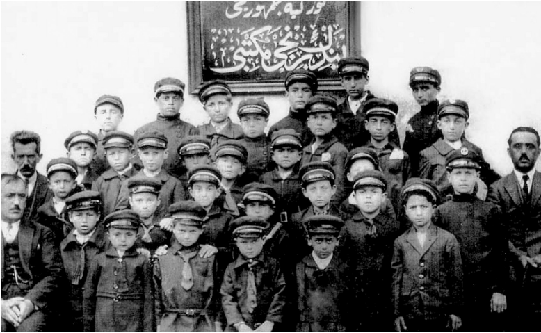
Τουρκογιαννιώτες μαθητές δημοτικού σχολείου στο Pendik της Κωνσταντινούπολης (1925-1926) 23

Οι σημερινοί απόγονοι των Τουρκογιαννιωτών στην Τουρκία, κατά βάση στην Κωνσταντινούπολη, σχηματίζουν μνημονικές κοινότητες –μέσω συλλόγων, εντευκτηρίων, βιβλίων, περιοδικών, διαδικτυακών σελίδων και οργανωμένων εκδρομών– και αποπειρώνται να διαχειριστούν την ιδιαίτερη προσφυγική τους ταυτότητα. 24